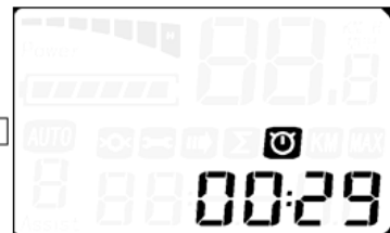
Temps de parours